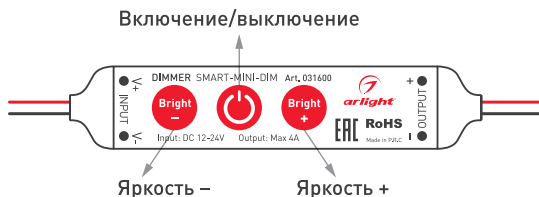
Рисунок 2. Назначение кнопок на корпусе SMART-MINI-DIM