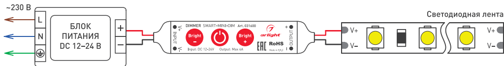
Рисунок 1. Схема подключения диммера SMART-MINI-DIM